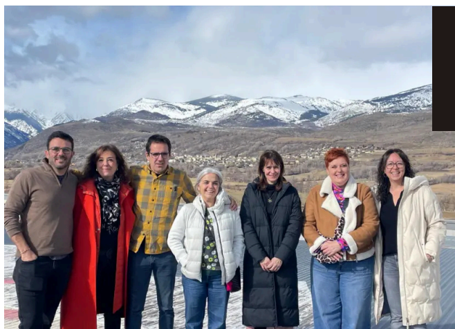
L'Hôpital de Cerdagne, cadre du 5e comité des directions des soins infirmiers de la Région Sanitaire Alt Pirineu i Aran

L'Hôpital de Cerdagne a accueilli la cinquième réunion du Comité de Direction des Soins Infirmiers de la Région Sanitaire Alt Pirineu i Aran.