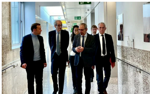
Le Préfet des Pyrénées-Orientales visite l'Hôpital de Cerdagne

Au cours de cette visite, les principaux défis et projets d'avenir du centre ont été présentés aux représentants institutionnels des deux États.