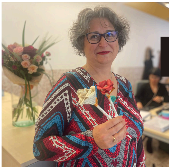
Sant Jordi : le temps que nous consacrons aux autres est un temps précieux

À l'occasion de la fête de la Sant Jordi, l'Hôpital de Cerdagne a tenu à remercier l'implication et l'engagement de ses professionnels à travers une création artisanale réalisée par une collaboratrice du centre.